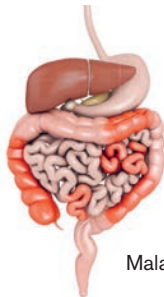
Maladie de Crohn

Malgré les recherches intensives, le facteur déclencheur de cette réaction reste encore inconnu à ce jour. Les thérapies sont certes de plus en plus efficaces, mais n'apportent toujours pas de guérison à l'heure actuelle. Les malades disposent d'une série de médicaments et peuvent s'appuyer sur la médecine complémentaire. Ces solutions permettent surtout de contenir l'inflammation et d'éviter l'apparition de complications. Des interventions chirurgicales peuvent être envisagées dans les cas graves. Les principales maladies inflammatoires chroniques intestinales sont la maladie de Crohn et la colite ulcéreuse.